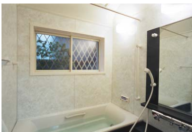
入浴中に換気扇を使用していると、温度の低い換気扇付近には、結露が発生しやすくなります。

住まいの湿気は気になりますよね。特に浴室は年中湿度が高く、温度変化も激しいところ。体を洗うだけでなく、心もリラックスできる場所だからこそ、清潔であって欲しいですよね。それには正しい換気が大切なのです！