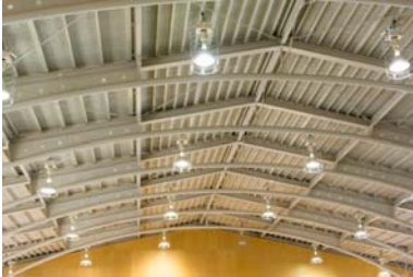
【特定天井の定義とは・・・】 質量が2kg/m 2 超で、6m 超の高さ かつ200m 2 超の面積を持つ吊り天井

東日本大震災から6年が過ぎようとしています。熊本県では、昨年4月に2度にわたる大地震に見舞われました。