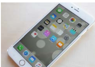
子供が寝ている母親の指でスマホのロックを解除し、おもちゃを購入したという出来事もあります。

今や携帯のロック解除にも利用される指紋認証。指紋は本人しか持ち得ないものなので、セキュリティ対策としての安全性は高いと思うのは当たり前です。なんとこの指紋認証が破られてしまう可能性があるのです。しかもSNS上に投稿した写真から・・・カメラを向けられて「はい、チーズ！」と言われたら、あなたはどんなポーズをとりますか？とりあえずにっこり笑ってピースサインですよ。その写した写真