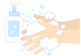
薬用せっけんを使うことで、免疫力低下やアレルギーなどが起こることもあるようです。

書いてある効果効能は、「お肌にうるおいを与える」といった程度。薬用せっけんに含まれる医薬部外品は、“おだやかな薬理作用が認められた成分が配合されているもの”で、「美白効果がある」と書いても良いそうです。効果の感じ方は人それぞれ。ただ薬用せっけんが細菌の増殖を防ぐ効果は、普通のせっけんや水と比べてもあまり効果に差はないのだとか！何で洗うかよりも、どのように洗うかが大切です。手のひらや指先、指の間などをしっかり洗うことでほとんどのウイルスは抑制できます。効果効能に頼らず、洗い方を見直すことが肝心です！