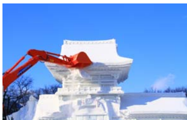
史上最大の雪像は、 【ガリバーようこそ札幌へ】 その高さは何と25m！ 第23回（昭和47年）製作

雪が降るこの季節。たくさんの地域で雪まつりが開催されます。中でも有名なのは、さっぽろ雪まつりですね。立ち並ぶ雪像の大きさには圧倒させられます。では、私達を楽しませてくれたあの大きな雪像は、雪まつりが終わったらどうなるのでしょうか？