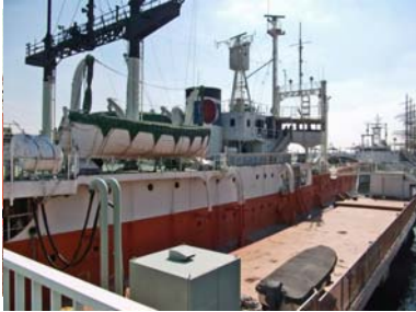
南極観測船『宗谷』は不可能を可能にした奇跡の船とされています。

昭和基地が開設して60年。当時は、月面基地の建設より遙か遠い所の話と言われていたのが南極観測用の建物でした。1957年2月、第一次南極観測隊用に建設された建物は全部で5棟。木製パネルの組立式家屋が4棟とパイプの骨組に断熱天幕を張った発電棟が1棟でした。極寒と強風が最大の特徴とされている南極大陸。その面積は、日本の約37倍。これだけの広さになると同じ南極といっても、場所によって環境にかなり違いが出てきます。沿岸部に建築を計画された昭和基地の気候は、風速80m/秒、最大積雪2m、平均気温-30℃、最低気