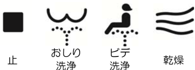
止 おしり 洗浄 ビデ 洗浄 乾燥