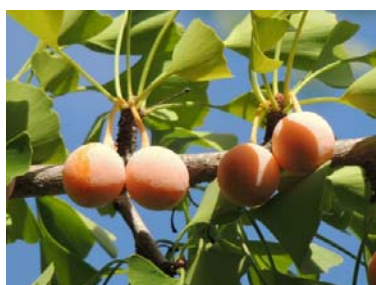
実が落ちた時の臭いは苦手ですが、銀杏のもっちり感はたまりません！

大阪・御堂筋で毎年恒例の独特のニオイがする季節になってきましたね。実は、イチヨウは生きて化石としてレッドリストの絶滅危惧種にも指定されています。イチヨウの木は、水はけがよく歪みが少ないため様々な用途で使用され、碁盤や将棋盤に適材です。そして特にイチヨウのまな板は高級とされます。御堂筋のイチヨウ並木は、大阪市の指定文化財になっていて、全国的にも有名なイチヨウ並木です。腐朽した木は適宜植