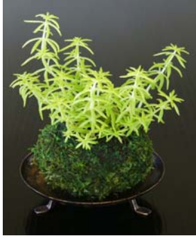
苔盆栽を飾って、和を楽しんでみていいですね♪

素敵なお庭にしたい！ガーデニング好きの方は、誰もが思う事ですよ。ちゃんと手入れしていても、ところどころ苔が生えて、緑色に汚れているような…。そんな少し厄介者の苔ですが、最近では癒しグッズになっているのですよ。ガラス容器などの中で植物を栽培することをテラリウムと言います。広い庭がなくてもガラス瓶がひとつあれば楽しめ、インテリアとして飾ることができる。誰でも気軽に緑を楽しむことができると人気を集めています。その中でも、なぜだか癒されると若い女性の間でじわじわとブームになっているのが苔テラリウムな