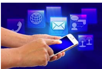
勝手に契約されてたとしても名義人が携帯電話不正利用防止法違反に問われる恐れもあります。

家に届いた荷物を転送するだけでお金がもらえる手軽なアルバイト「荷受代行」が問題となっています。SNSで指定のIDにメッセージを送ると、仲介者と名乗る人物から返信が来ます。氏名や住所など個人情報に加え、顔写真入りの証明書の画像やアルバイト料の振込先として口座番号の送信も求められます。そして数日後荷物が届き、指定された場所へ転送する。これだけで2～5千円のバイト代が振り込まれるのですが、なんと転送