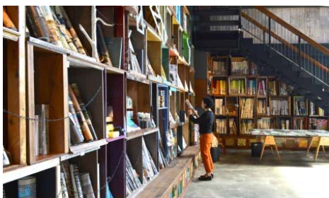
WALLPAPER MUSEUM WALPA

㈱フィルが運営する輸入壁紙専門店「WALPA（ワルバ）」が、厳選した壁紙を集めた博物館「WALLPAPER MUSEUM WALPA（ウォールペーパー・ミュージアム・ワルバ）」を大阪市大正区にオープンしました。ここでは、WALPAが取り扱う世界中から選りすぐった壁紙約2万点の中からさらに厳選された壁紙がズラリと揃っています。街全体がリバーサイドともいえる大正区から世界への船出というコンセプトのもと、数百冊の見本帳を取り揃えた館内は、まるで壁紙の方舟のように世界中の良質なデザインが見られるようになっています。