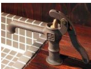
DaReya【井戸端蛇口】 こんなレトロなデザインも！

収益が出るほど売れた時点で“面白くない”蛇口になるので一定数に達すると生産を中止し、新型の開発へ移るのだとか。