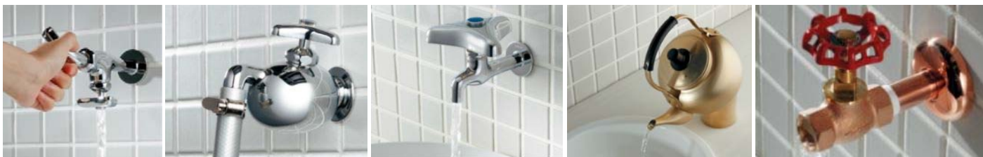
左から順に…誰や！パイプ上向きにしたん？ / 誰や！ホースの先踏んでんのん？ / どっか〜ん / 魔法の水 / 誰や！工事、途中でやめたん？

由来は「誰や！こんな蛇口つくったん？」という関西弁らしいのですが、見てみると確かにそうツッコミたくなるものばかり！