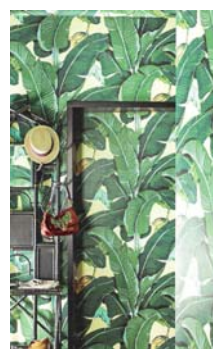
【Beverly Hills Wallpaper】

名門ホテルビバリーヒルズ・ホテルに使われている壁紙。知る人ぞ知る人気のデザインです。