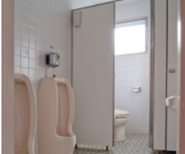
公共施設は、防犯性が高い・一目で空いているとわかるという点から、内開きが採用されています。

トイレのドアは、住宅では外開き、店舗など公共施設では内開きが一般的です。住宅の場合、部屋に入るドアは基本的には内開き。廊下から部屋に向かって押すものが多いですよ。これにはきちんと理由があります。人の通る廊下側に開く外開きでは廊下にいる人に当たってしまう可能性があり、危ないですよ。また部屋に招き入れるという点からも、内開きの方がスムーズに感じますね。しかし、住宅のトイレは古い家を除き、ほとんどが外開きです。昔のトイレは床がタイル貼りになっていて水を流して掃除できるような作りになっていたため、