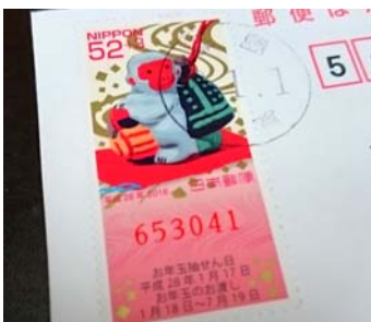
お年玉の抽せん日は17日！ もちろん年賀切手にもついています♪

ところで、年賀状の中に「A Happy New Year」と書いてあった年賀状はありましたか？実は、最初にAがついていると、「良いお年を」という意味になるので間違いなのです。「新年あけましておめでとうございます」も、「新年」と「あけまして」の意味が重複しているので、どちらかひとつにするのが正解。他にも、目上の人には2文字の賀詞は避けるなど、いろいろなマナーがありますよね。今年の手遅れかもしれませんが...来年の年賀状は、気を付けて下さいネ。