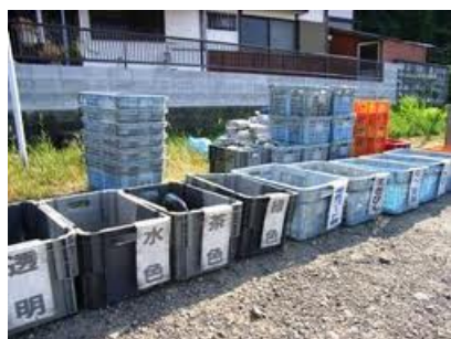
水俣市はごみの分別は21種類（ガラス瓶だけでも4種類に分別）小学校でも自分たちが出したごみはきちんと分別しています

ごみの分別の始まりは、大気汚染（ダイオキシン問題）が話題になり始めた1990年代から。それまでは可能だった家庭の焼却炉でのごみ処理が禁止され、ごみの分別が進んでいきました。1990年代後半からは、温室効果ガスの排出量を削減することも注目され、大量生産・大量消費から、エコへと移り変わりました。この頃から、私達のごみに対する考え方が変わってきたと言えます。ごみの分別は、日本が世界一！ヨーロッパやアメリカなどの先進国でも一応分別はされているものの「普通のごみ」と「リサイクルできるごみ」の2種類程度。こんな簡単な分別でもルールを守っていない人も少なくはないのだとか。