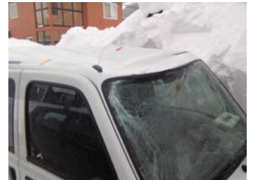
しまり雪が屋根から落ちると…、車の屋根がへこむほどの衝撃が!