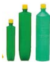
でんぶん糊 ヤマト