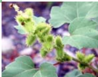
【オオオナモミ】 棘が密に生えて いるのが特徴