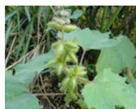
【オナモミ】 鋭いカギ状の 棘が特徴