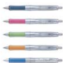
ドクターグリップ パイロット