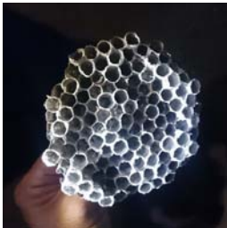
蜂の巣を見つけても、あわてずに。去年の巣が残っていた！なんて場合も

蜂は、冬は冬眠し、春から秋にかけて活動します。比較的、大人しいと言われるアシナガバチの攻撃性が1番高まるのは7～8月にかけて。スズメバチやミツバチと比べて巣も小さめで、働き蜂の数も少ないのが特徴です。もう活動時期も終わりに近づいているので、人通りの多いところ以外は、必ず駆除しなければいけないということもあります。そして、今の時期に危険なのがスズメバ