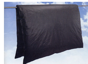
カバーは、ホームセンターやネットなどで購入できます。できるだけ濃い色で通気性の良いものを！

カバーやシーツをかぶせましょう。ダニは60度以上で死滅すると言われてるので、色の濃いシーツなどで布団内部の温度を上げるとさらに効果的です。面倒でも、途中で裏返してきちんと両面を日に当てるようにしましょう。午後3時以降になると、湿度が高くなってしまいますので、それまでに取り込むのがベスト。布団をたたくのはNGというのは随分知られるようになりましたが、取り込んだ後に、掃除機をかけると◎外に干せない日が続く場合は、部屋で干しておくだけでも十分です。正しい布団の干し方をマスターして、快適な睡眠を！