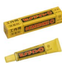
セメダインC セメダイン