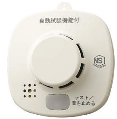
大建工業株式会社 住宅用火災警報器 『火の元監視番』 SA04-1 メーカー希望小売価格 オープン価格

住宅用火災警報器『火の元監視番』をメーカーからの協力を得まして、 ¥1980.- （消費税込・取付工事費別途）にてお届けいたします。特別価格の為、限定50台とさせていただきます。電池式なので、簡単に取付可能です。もう一度、大切な住まいの火災報知器をご確認しご検討ください。