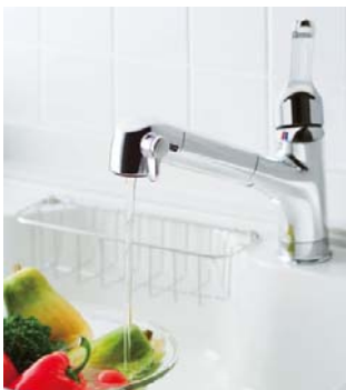
オールインワン浄水器 (LIXIL)

現代の日本では、水道の蛇口をひねると簡単に水が出てきます。その水道から出てくる水のほとんどは浄水場で安全な水にする為に塩素で殺菌されていますが、その塩素によって少なからず味に影響が出てしまい、飲み水としては敬遠されがちです。近年“おいしい水が飲みたい”という志向が高まっています。昨年の東日本大震災以後、さらに水の安全性への関心も増し、ミネラルウォーターが市場から消えたのも記憶に新しい出来事です。最近よく見かけるウォーターサーバー。すぐに冷水や熱湯が出せ、非常用水としても備えておける利点はありますがボトルやサーバーの保管場所や経費がかかる為、一般家庭