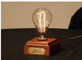
▲エジソン電球のレプリカ

10月21日は電球の日！1879年10月21日にエジソンによって開発された実用的な白熱電球が40時間連続点灯したことにちなんで1981年に制定されたそうです。